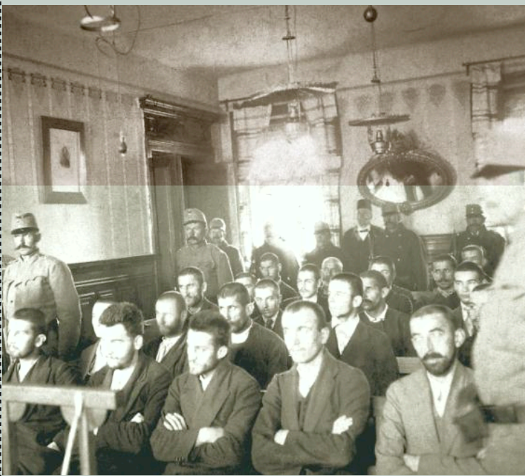
Muzej Sarajevo, Sarajevo u Austro-Ugarskoj 1914-1918