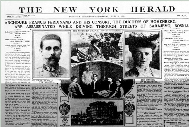
http://blog.postcardgallery.net/i/pics/nyh-06-29-1914-saraevo-assassination.jpg (New York Herald, New York daily paper published in the period 1835 to 1924), downloaded on 2 June 2013

Domenica del Corriere (italijanski sedmični list)