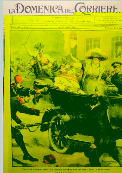
http://previews.agefotostock.com/previewimage/bajaage/510b7d637895591db19d6200dd4aa0f2/DAE-11319783.jpg downloaded on 27 Feb. 2012)

Katastrofa u Sarajevu. Atentat na nadvojvodu Franca Ferdinand i Vojvotkinju od Hohenberga. Sa bombom i brovingom. Prijestolonasljednik i njegova supruga ubijeni. Dva atentata. (...) Atentatori uhapšeni. Povratak cara.